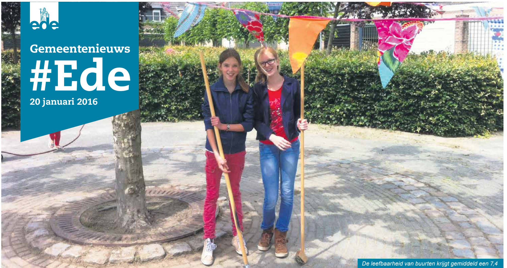
De leefbaarheid van buurten krijgt gemiddeld een 7,4